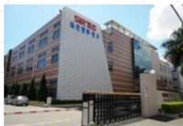
東莞協隆廠 東莞協勝廠 東莞協益光電