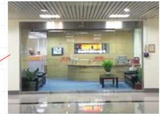
總管理處-中正區 業務單位與影像-三重區

地理位置：台北市中正區/新北市三重區 佔地面積：1,154m 2 從業人員：35人/53人 集團營運管理